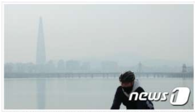
전국 미세먼지 농도가 한때 나쁨수준을 보인 2일 경기 구리한강공원에서 바라본 용인막 대교와 롯데월드타워 일대가 무명 다 20181209뉴스1 @News1 만은니기자