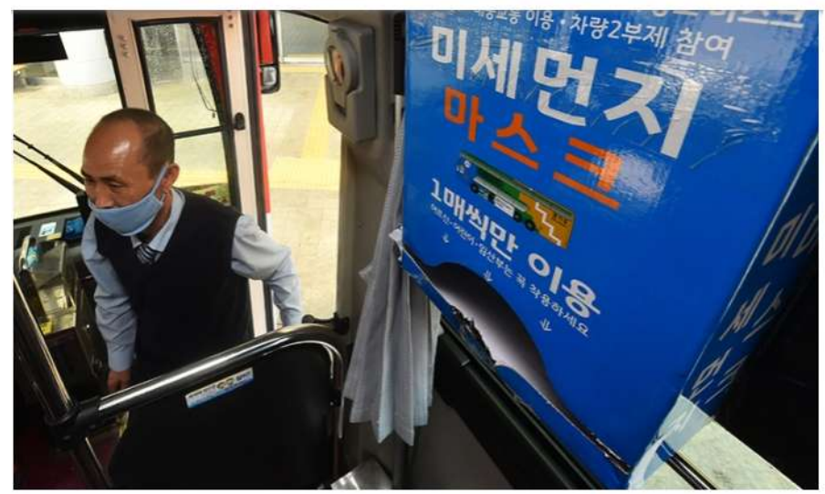
미세먼지 마스크 배포. 사진=중부일보DB